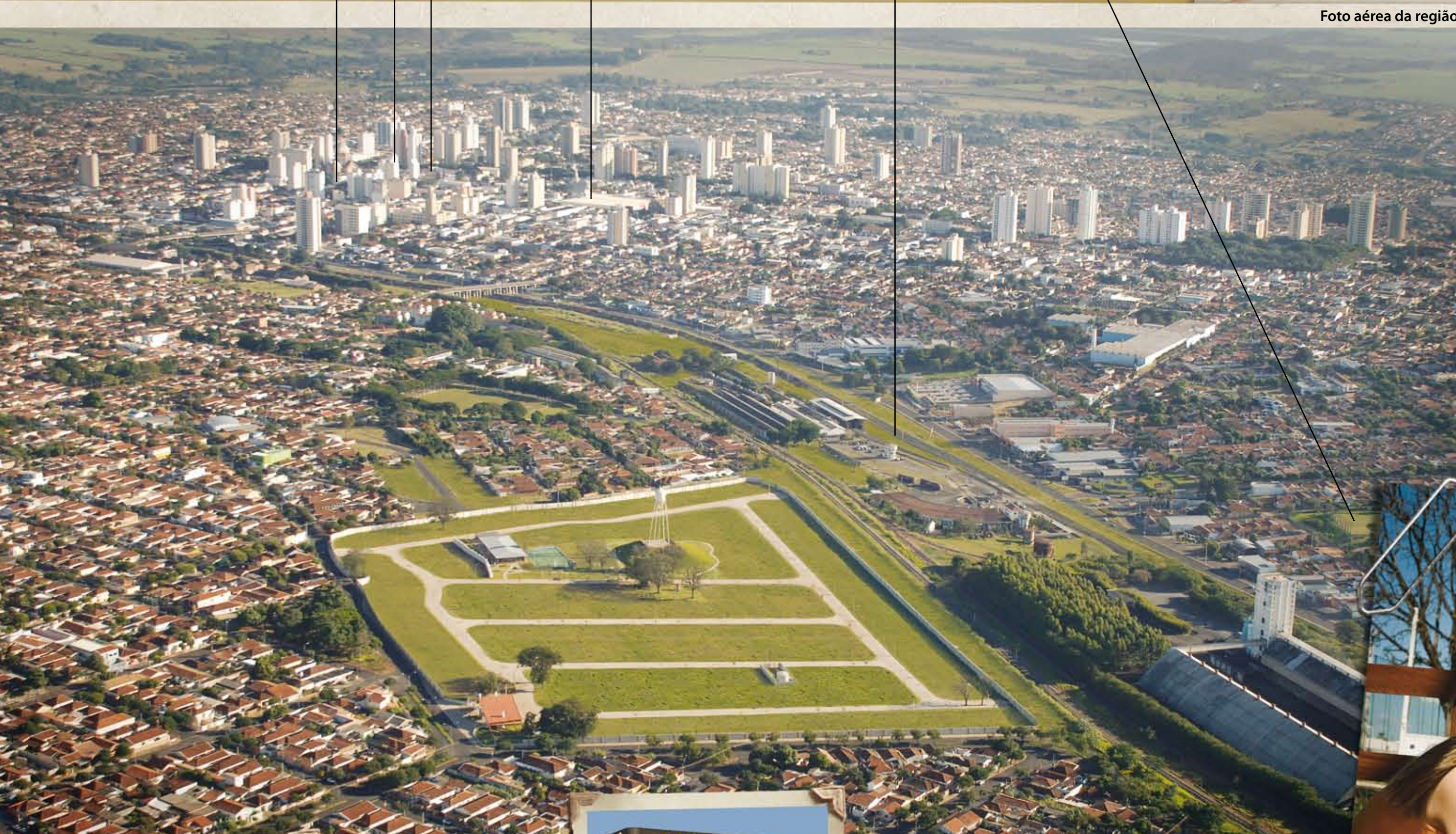
Foto aérea da região

Uniara Matriz São Bento Shopping Lupo Extra Supermercados Via Expressa Campo Ferroviária "Gigantão"