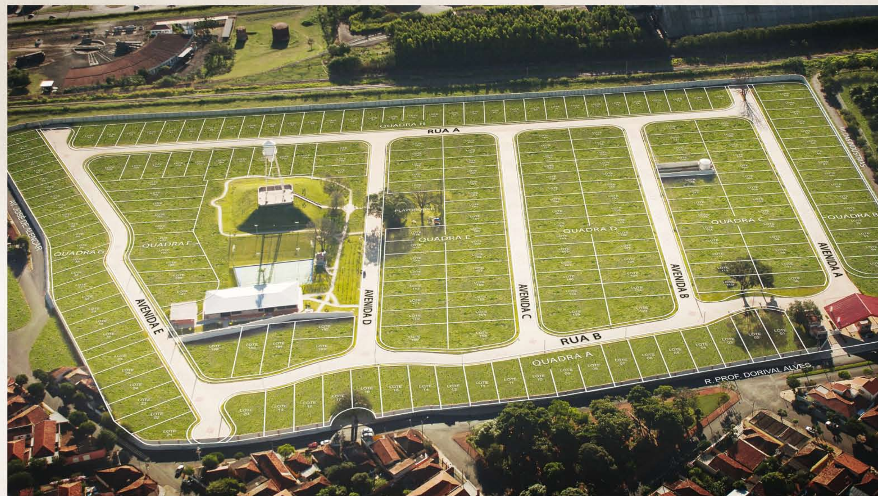
Foto aérea da região

(*Sujeito à aprovação de cadastro, conforme correções disponíveis no plantão de vendas).