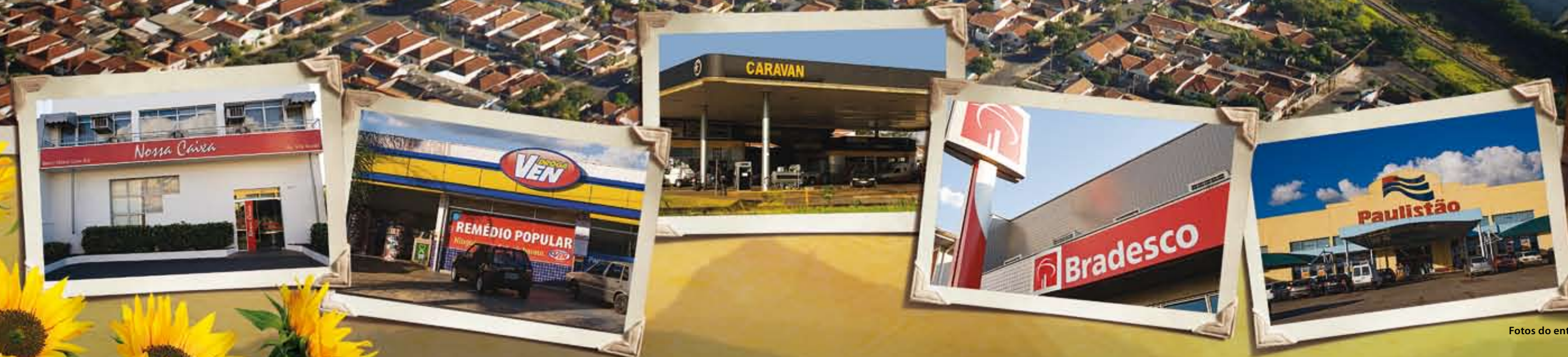
Fotos do entorno